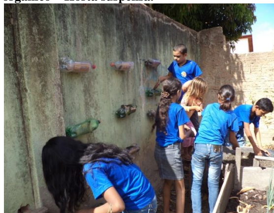
Figura 04 – Estudantes adicionando substrato orgânico – Horta suspensa.