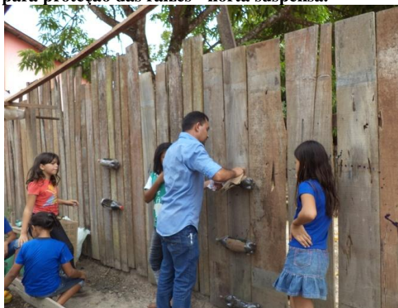
Figura 01 – Fixação de papelão nas garrafas para proteção das raízes - horta suspensa.

O espaço da horta também serviu como um laboratório experimental a partir das oportunidades e limitações de recurso e infraestrutura disponível na escola, como por exemplo, a horta suspensa. Nesta modalidade de horta foram utilizados dois tipos de materiais para revestir e proteger os recipientes e/ou canteiros feitos de garrafas pet, em metade das garrafas utilizou-se pedaços de papelão encontrados no depósito da escola, na outra metade aplicou-se tinta acrílica de cor azul, tinta que sobrou da última reforma na escola, nas imagens abaixo é possível observar os educandos participando das atividades de construção da horta suspensa.