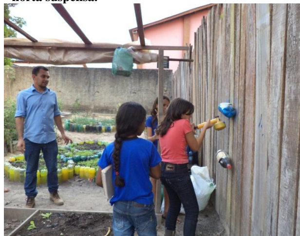
Figura 02 – Aplicação de tinta acrílica nas garrafas – horta suspensa.